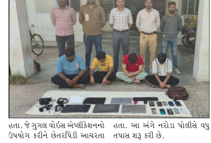
હતા. જે ગુગલ વોર્ડસ એપ્લિકેશનનો ઉપયોગ કરીને છેતરપિંડી આચરતા હતા. આ અંગે નરોડા પોલીસે વધુ તપાસ શરૂ કરી છે.