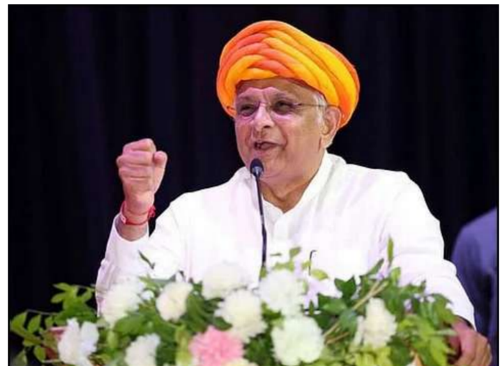
વિશ્વ આખું આજે ગુજરાતના વિકાસ મોડલથી પ્રભાવિત થઈને ગુજરાત તરફ આકર્ષણ: મુખ્યમંત્રી શ્રી ભૂપેન્દ્ર પટેલ

મુખ્યમંત્રીશ્રી : ● તાજેતરમાં સ્થાનિક સ્વરાજની ચૂંટણીઓમાં જનતાએ અમને પ્રચંડ સમર્થન આપીને વિશ્વાસ અકબંધ રાખ્યો છે, આ પ્રેમનો નતમસ્તક અમે ઋણ સ્વીકાર કરીએ છીએ ● વડાપ્રધાન શ્રી નરેન્દ્ર મોદીના વિજનરી નેતૃત્વ થકી શરૂ થયેલી 'વાઈબ્રન્ટ સમિટ'ની સતત સફળતાને પગલે ગુજરાત આજે 'ગ્લોબલ ગેટ-વે ટુ ધી ફ્યુચર' અને દેશમાં સૌથી ઓછો બેરોજગારી દર ધરાવતું રાજ્ય બન્યું ● ઈન્ફ્રાસ્ટ્રક્ચર ડેવલપમેન્ટના ધ્યેય સાથે સુરત અને તેની આસપાસના વિસ્તાર માટે 'સુરત ઈકોનોમિક રિજીયન ડેવલોપમેન્ટ પ્લાન' તૈયાર : ઉત્તર ગુજરાત, સૌરાષ્ટ્ર, મધ્ય ગુજરાતના વિસ્તારોના સર્વાંગી વિકાસ માટે નવા દે રિજનલ ઈકોનોમિક માસ્ટર પ્લાન તૈયાર થઈ રહ્યા છે