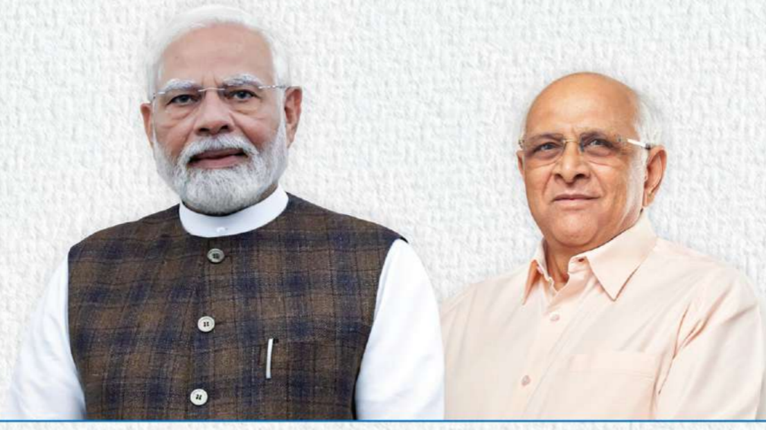
શ્રી નરેન્દ્ર મોદી માનનીય વડાપ્રધાન