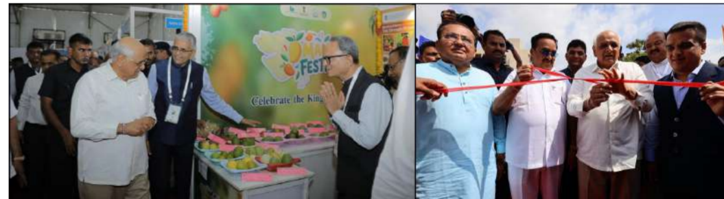
ઓરો યુનિવર્સિટી ખાતે ઔદ્યોગિક વિકાસ, ગ્રીન એનર્જી, કૃષિ અને સેવા ક્ષેત્રના સર્વાંગી વિકાસને પ્રતિબિંબિત કરતું વિશાળ પ્રદર્શન ખુલ્લું મુકાયું: પ્રદર્શન ખુલ્લું મૂકી મુખ્યમંત્રીશ્રીએ વિવિધ સ્ટોલની મુલાકાત લઈ પ્રત્યક્ષ નિરીક્ષણ કર્યું

પ્રધાનમંત્રીશ્રીએ X પર પોસ્ટ કર્યું: "ગુજરાત રિજનલ કોન્ફરન્સના શુભારંભ પૂર્વે ઓરો યુનિવર્સિટી કેમ્પસમાં યોજાયેલા વાઈબ્રન્ટ ગુજરાત રિજીયનલ એકઝીબિશનનું વિધિવત ઉદ્ઘાટન કર્યું હતું. આ પ્રસંગે રાજ્યના ઔદ્યોગિક વિકાસ, કૃષિ પ્રગતિ, ગ્રીન એનર્જી અને સેવા ક્ષેત્રના સર્વાંગી વિકાસને પ્રતિબિંબિત કરતું વિશાળ પ્રદર્શન ખુલ્લું મુકાયું: પ્રદર્શન ખુલ્લું મૂકી મુખ્યમંત્રીશ્રીએ વિવિધ સ્ટોલની મુલાકાત લઈ પ્રત્યક્ષ નિરીક્ષણ કર્યું