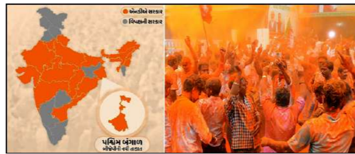
હવે આ ૨૨ રાજ્યોમાં ભાજપ સરકાર દિલ્હી, ઉત્તરાખંડ, ઉત્તર પ્રદેશ, હરિયાણા, રાજસ્થાન, ગુજરાત, મહારાષ્ટ્ર, ગોવા, મધ્ય પ્રદેશ, છત્તીસગઢ, ઓડિશા, સિક્કિમ, અરુણાચલ પ્રદેશ, આસામ, નાગાલેન્ડ, ત્રિપુરા, મેઘાલય, મિઝોરમ, બિહાર, આંધ્ર પ્રદેશ, પશ્ચિમ બંગાળ અને મણિપુર.

હોય કે ભારતીય રાજકારણના ફલક પર 'ભગવો' અને 'NDA'નો ઝંડો ફરી એકવાર પૂરી મજબૂતી સાથે લહેરાઈ રહ્યો છે. ૨૦૧૪માં જ્યાં NDA માત્ર ૮ રાજ્યો સુધી સીમા દેખાઈ હતી, આજે ૨૦૨૬માં આ આંકડો વધીને ૨૨ રાજ્યો અને કેન્દ્રશાસિત પ્રદેશો સુધી પહોંચી ગયો છે. ભાજપના ૪૭મા સ્થાપના દિવસની ઉજવણી વચ્ચે, ચૂંટણીના વલણો દેશના રાજકીય નકશાને એક નવો